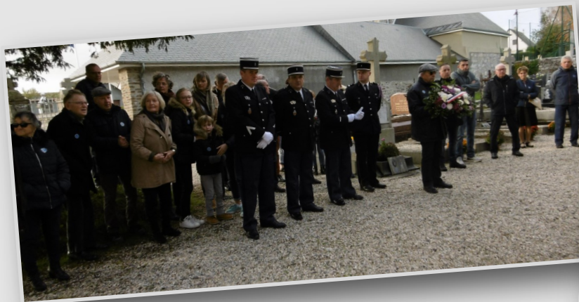
Commemoration - le 11 novembre 2019

Si des personnes souhaitent participer à ces journées ou matinées en 2020, elles peuvent s'inscrire en mairie.