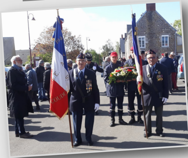
Commémoration - le 8 mai 2019