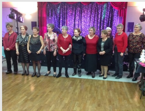
Ces dames de l'orchestre éphémère

ATTENTION , à vos agendas, il faut déjà penser à ouvrir les portes à l'an nouveau en fixant la date de notre prochaine ASSEMBLEE GENERALE qui se tiendra LE JEUDI 23 JANVIER 2020 à 14h30 à la salle des Fêtes Communale . Il n'y a pas de limite d'âge pour adhérer à notre CLUB. Nous invitons donc l'ensemble des jeunes et moins jeunes qui désirent rejoindre notre dynamique CLUB DE L'AMITIE à venir partager la galette des Rois et élargir encore le nombre de nos adhérents. Cotisation : 12 €uros