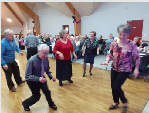
Twist and twist, allez, venez twister