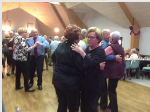
Alors, on danse !!!!

ATTENTION , à vos agendas, il faut déjà penser à ouvrir les portes à l'an nouveau en fixant la date de notre prochaine ASSEMBLEE GENERALE qui se tiendra LE JEUDI 23 JANVIER 2020 à 14h30 à la salle des Fêtes Communale . Il n'y a pas de limite d'âge pour adhérer à notre CLUB. Nous invitons donc l'ensemble des jeunes et moins jeunes qui désirent rejoindre notre dynamique CLUB DE L'AMITIE à venir partager la galette des Rois et élargir encore le nombre de nos adhérents. Cotisation : 12 €uros